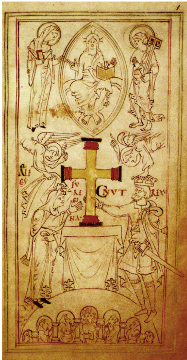
Kung Knut den store och drottning Ælfgifu avbildade på ett handmålat manuskript från ca 995-1035.

knut kung. Han levde ogift och när han dog av hjärtslag under en väns bröllop i London stod Danmark utan regent. Den norske kungen Magnus den gode tog då också över regentskapet i Danmark. Nu blandade sig emellertid Sven Tveskäggs systerson Sven Estridsen i kampen om Danmarks krona. Efter ett antal år med svåra strider mellan honom och Magnus den gode kunde Sven slutligen året 1047 bli hyllad som dansk kung. Hans motståndare trillade nämligen av hästen och bröt nacken.