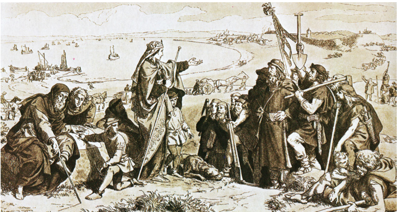
Enligt en gammal legend stod den mäktiga drottning Thyra bakom byggandet av den stora försvarsvallen Danevirke i Jylland på gränsen mot Tyskland. Detta har visat sig felaktigt. Vallen började byggas på 700-talet, tvåhundra år innan Thyras livstid.

Frankernas mäktige härskare Karl den store kom till