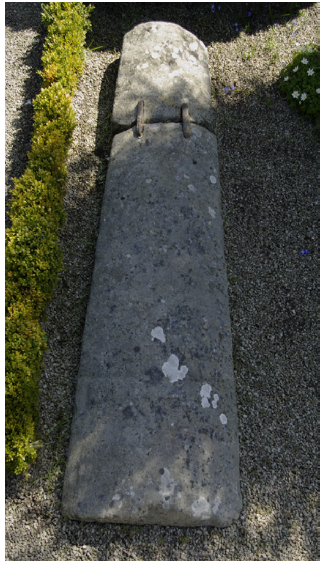
Denna gravsten direkt väster om Dalby kyrkas kor menas ligga över den danske kungen Harald Hen, död år 1080 och begravd i Dalby.

Den mäktige Knut dog år 1035. Hans död innebar också att det stora danska Nordsjöimperiet som han byggt upp gick under. I Danmark blev sonen Harde-