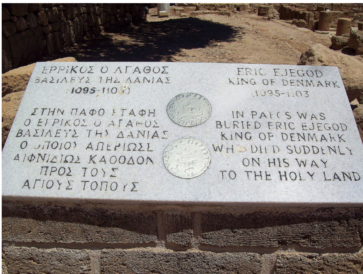
Minnesplatta över Erik Ejegods grav på Paphos, Cypern. Kungen dog här år 1033 på pilgrimsresa till det heliga landet.

Därmed är vi framme vid den fjärde sonen Erik Ejegod som fick ta över ett lyckligare regentskap än sin bror Oluf. Missväxten upphörde och de stora förväntningarnas tid verkar ha inträffat. Erik arbetade hårt på att få sin mördade bror Knut helgonförklarad. År 1104 dog han emellertid på väg till det heliga landet och hans yngre bror Niels, den femte i brodersräckan, blev kung; ett regentskap som varade fram till dess han mördades sommaren 1134 och Erik Ejegods son Erik Emune tog över. Denne hade som segrare i slaget vid Foteviken den 4 juni 1134 på ett dramatiskt sätt tagit över regentskapet över Danmark.