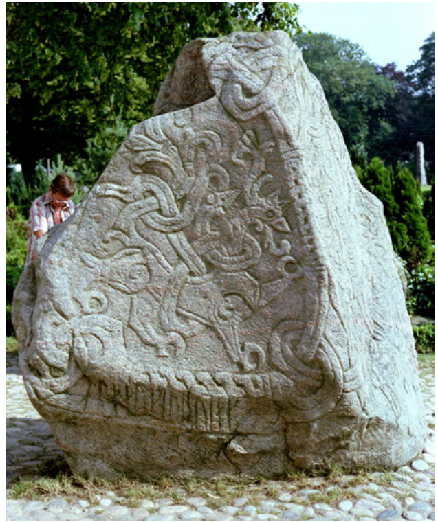
Harald Blåtand lät resa denna bild- och runsten bredvid sin faders runsten i Jelling. Texten lyder i översättning:

Gorm och Thyra fick flera barn, däribland Harald som skulle få smeknamnet Blåtand. Det verkar som om sonen Harald Blåtand varit medregent en tid redan under faderns levnad. Om Harald vet vi att han, till skillnad mot fadern, var vänligt inställd mot de kristna. Året 948 vigde ärkebiskop Adaldag av Hamburg/Bremen tre biskopar för verksamheter i Danmark. Detta år måste därför rimligtvis Harald ha regerat, något annat är otänkbart då fadern var hatisk mot de kristna. Harald måste dessutom ha varit kung året 954 då den förvisade norske kungen Erik Blodöx dog i England och hans hustru Gunhild med sina söner kom till honom i Danmark. Harald tog emot flyktingarna och knäsatte till och med Eriks och Gunhilds barn Harald Gråfäll.