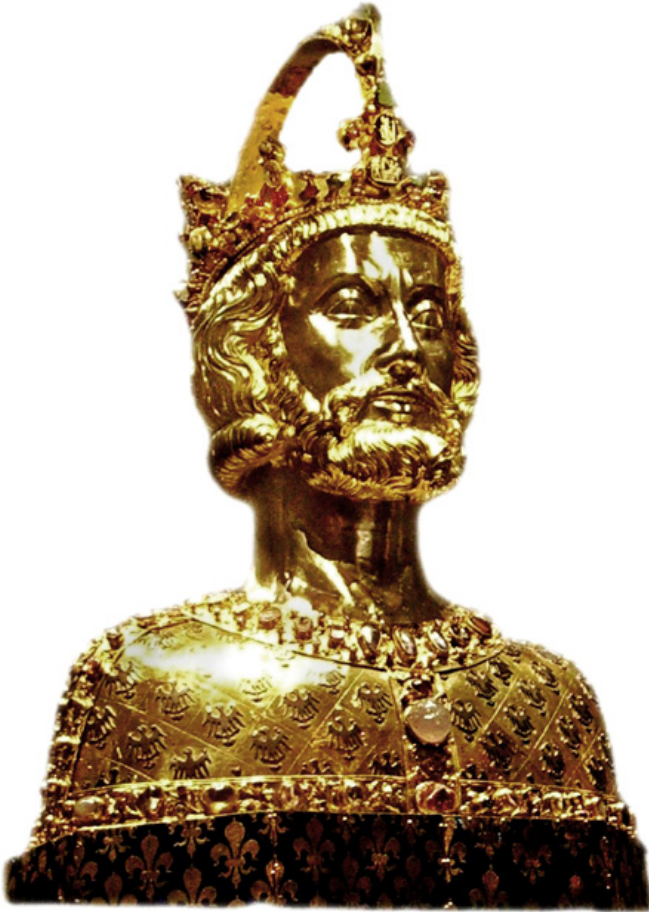
Karl den store. Sentida byst i Aachen domkyrka, troligen tillverkad efter 1349. Aachen var kejsar Karls huvudpalats.

makten året 768 och tre år senare blev han ensam regent av frankerriket. År 772 började Karl utvidga sitt väldiga rike åt nordväst, in i sachsarnas land. Samma område är i dag tyska Sachsen, Westfalen, Hannover och Oldenburg norr om Lübeck. Inte mindre än arton fältslag kom att stå mellan franker och sachsare innan fred kunde uppnås. En av sachsarnas ledare, Widukind, tvingades år 777 att fly till danskarnas kung Sigfred. Även om danskarna inte direkt var involverade i krigshandlingarna blev det snart förhandlingar mellan kung Sigfred och Karl den store. Att den segerrike frankerhärskaren med sina stora styrkor inte attackerade Sigfred kan tyda på att danskarna har varit så starka att detta inte låtit sig göra. Karl den store verkar dock inte ha haft några höga tankar om sin granne i norr, vilket framgår av hans ord till en av sina fredsförhandlare ”om ej heller du vill träda fram för den uppblåste Sigfred som med gudalös stav nu styr ett förpestat rike”.