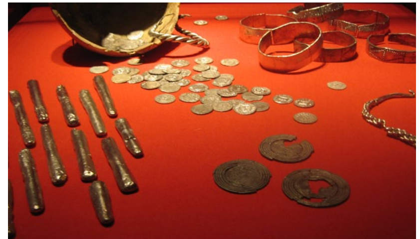
Vikingaskatt i silver, finns att beskåda på Rijksmuseum van Oudheden (Leiden Museum), Holland.

Priset på en slav kring 900 e.Kr. var 50 gram guld i södra Europa, och 150 gram guld i kalifatet. De lokala hövdingarna skulle ha en andel av förtjänsten. Slavar var skrymmande och man uppskattar