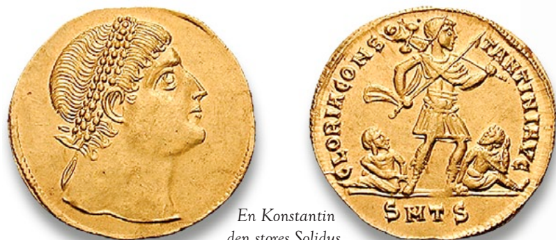
En Konstantin den stores Solidus.

Guld var ett populärt betalningsmedel eftersom det var sällsynt, värdebeständigt, oförstörbart, lättbearbetat och mytiskt. Det mesta guld i Skandinavien på denna tid kom från det romerska imperiets skattkammare. Guld utformades oftast som vackra smycken. Brakteater var ett av de populäraste och bildmässigt mycket uttrycksfulla guldsmyckena. Först var de kopior på de medaljer som romerske kejsaren delade ut som gengävor. Därefter, ca 400-500 e.Kr., präglades brakteater med nordiska motiv.